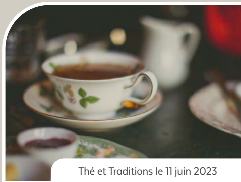
Thé et Traditions le 11 juin 2023

Le Musée présentera sa candidature pour le prochain appel de projets en juin 2023 pour la réalisation d'une exposition virtuelle portant sur l'histoire de l'église anglicane Christ Church et les débuts du village de Saint-André. En plus de commémorer la contribution vitale de Christ Church à l'histoire de la Municipalité et de la région d'Argenteuil, ce projet permettra aussi de mettre en valeur et de faire connaître plusieurs artefacts et archives de la collection du Musée sur une plateforme numérique pouvant rejoindre un vaste public autant au Canada qu'à l'extérieur de ses frontières.