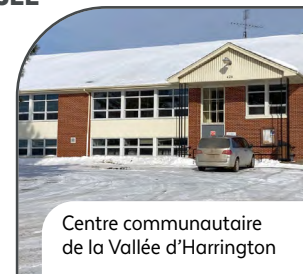
Centre communautaire de la Vallée d'Harrington

C'est finalement en janvier et février 2022 que la collection du Musée a été nettoyée, emballée et transportée au Centre communautaire de la Vallée d'Harrington où elle occupe trois locaux. Un local est dédié aux archives et les deux autres locaux servent à l'entreposage de la collection. Depuis le début 2023, le Musée travaille en collaboration avec le Centre d'archives agréées, Histoire et Archives Laurentides afin d'installer un centre de documentation et de consultation d'archives.